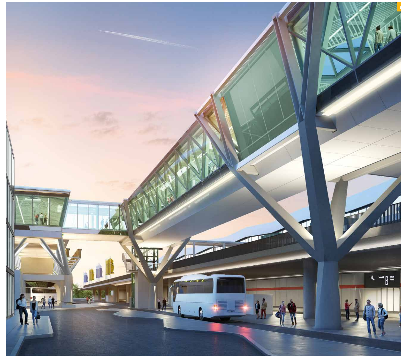
6 Personen-Transport-System (PTS) Flughafen Frankfurt a.M. Personen-Transport-System zur Verbindung der Terminals am Flughafen Frankfurt // Brandschutzkonzepte, Heißbemessung, Simulation der Rauchausbreitung, Entfluchtungssimulation