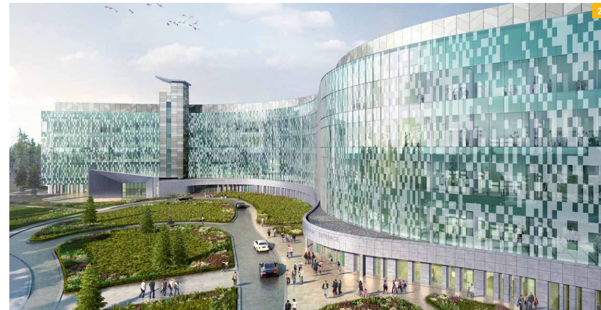
1 Spandauer Ufer, Berlin Multifunktionales Gebäude mit Verkaufsstätte, Versammlungsstätte, Beherbergungsstätte in einem Hochhaus // Brandschutzkonzepte in BIM-Planung

Unsere Auftraggeber profitieren von einem interdisziplinären Ansatz, der im Sinne der Gesamtplanung tiefgehende Brandschutzkenntnisse mit statischen, gebäudetechnischen, architektonischen und wirtschaftlichen Aspekten vereint. Stets die erforderlichen Schutzziele im Blick, erfüllen wir nationale bauordnungsrechtliche Anforderungen sowie internationale Standards.